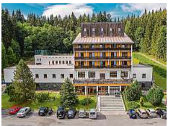
Pobyt v hotelu Kamzík si užije celá rodina.

Součástí areálu je i moderní dětské hřiště, na kterém děti ocení trampolínu, případně houpačky. K hotelu vede samostatná přístupová cesta a provoz motorových vozidel je minimální. „Po celodenních výletech si hosté rádi posedí u venkovního ohniště, a pokud to počasí dovolí, u naší depandance, Horského hotelu Moravice, vzdáleného asi 50 metrů od Kamzíku, najdou klienti volně přístupný venkovní bazén,“ vyjmenovává další výhody pobytu v Hotelu Kamzík Milan Vitula a dodává: „V roce 2017 jsme rekonstruovali i krytý vyhřívávací bazén s kapacitou 20 osob, který je volně přístupný všem u nás ubytovaným hostům.“